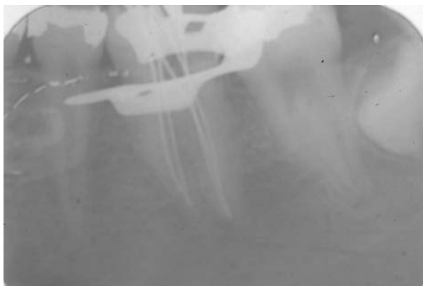
Fig. 2. Conductometría.

Con la técnica de "Crown-down", se llegó con limas del 25 a los ápices de todos los conductos, a excepción del conducto central de la raíz distal al que se llegó con la 20. Después se rellenaron los conductos con gutapercha y cemento (AH plus) usando la técnica de condensación lateral y se colocó una obturación provisional (Cavit-espe) (Figs. 3 y 4). Tras una semana habían desaparecido todas las molestias.