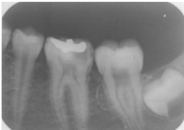
Fig. 1. Primer molar inferior con retracción del cuerno pulpar.

y se retiró la restauración de amalgama; al abrir la cámara pulpar para realizar la conductometría se descubrieron cinco conductos, dos mesiales y tres distales (Fig. 2).