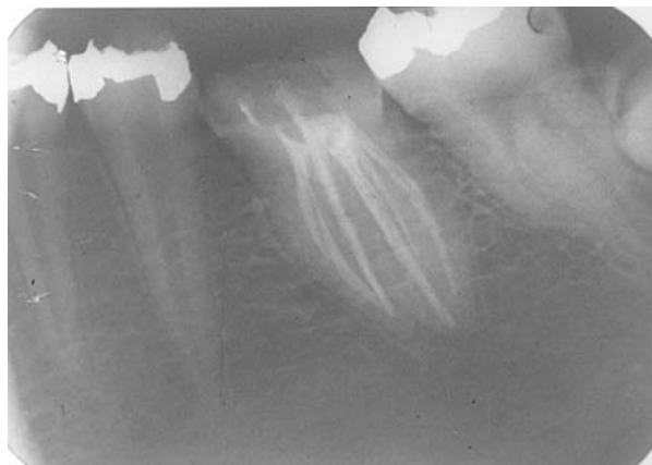
Fig. 3. Relleno de conductos.

Las bases principales para limitar el error en el tratamiento son el uso de radiografías, una meticulosa exploración con limas y la apertura correcta de la cámara pulpar que nos permita una visibilidad perfecta. Sin embargo las radiografías sólo nos permiten ver el diente en dos dimensiones, lo que limita su utilidad puesto que no permite diferenciar claramente todas las posibles variaciones morfológicas. Por esta razón es importante